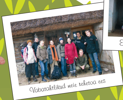
Vabatahtlikeud meie reketoa ees