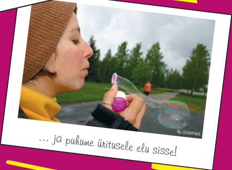
... ja puhume üritusele elu sisse!