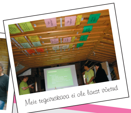
Meie tegevuskava ei ole laest võetud