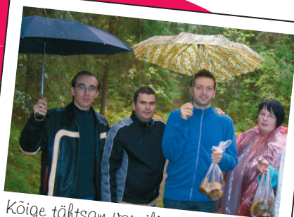
Kõige tähtsam vormiline raam on see, et ... vihmavari oleks kaasas...