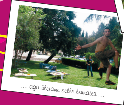
... aga ületame selle lennates....