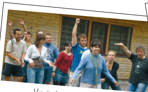
Meie kuulus jenka tantsimise taktika!

Kuidas aga tutvustada programmi Euroopa Noored köitvalt ja osalejaid kaasavalt? Kuidas võimaldada üksteise organisatsioonidega tutvuda nii, et kõik saaksid piisavalt infot, kuid samas sessioon liiga pikaks ei veniks ja inimeste tähelepanu seetõttu hajuma ei hakkaks?