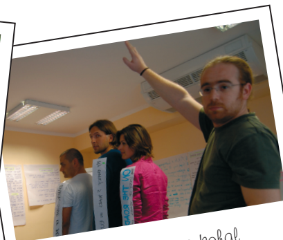
...või katus pea kohal