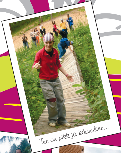
Tee on pike ja käänuline...