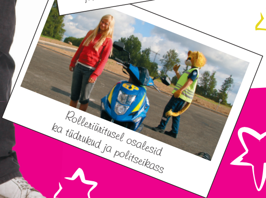
Rolleriüritusel osalesid ka tüdrukud ja politseikass