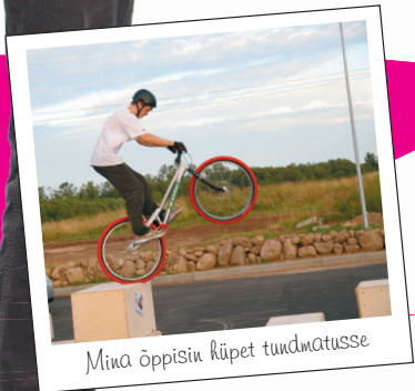
Minu õppisin küpet tundmatusse