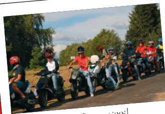
... ja võtame nööri!