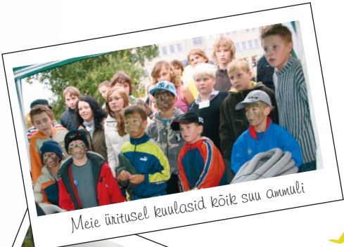
Meie üritusel kuulasid kõik suu ammuli