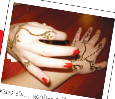
Kirev elu... maalime selle ise valmis!!